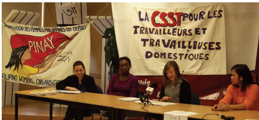
Conférence de presse le 21 février 2009

au Canada. Voilà pourquoi quelques organismes (le Centre des travailleurs immigrants, l'Association des aides familiales du Québec, l'Union des travailleurs accidentés de Montréal, l'Association des travailleurs philippins) se sont regroupés pour former une Coalition ayant pour but d'exiger que les aides familiales résidentes soient couvertes par la CSST. Il est à noter que 80 autres organisations – y compris la Fédération des femmes du Québec, bien sûr ! – soutiennent ce combat.