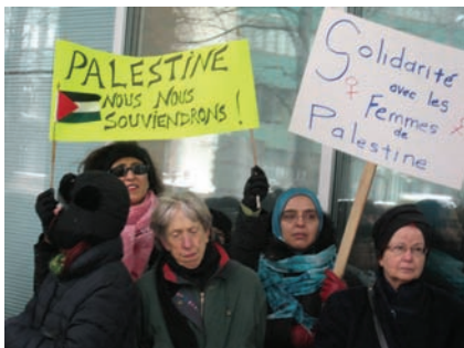
Rassemblement en appui aux femmes Palestiniennes, Montréal, le 22 janvier 2009